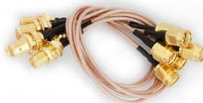
长度20cm/衰减小于0.5dB/镀金