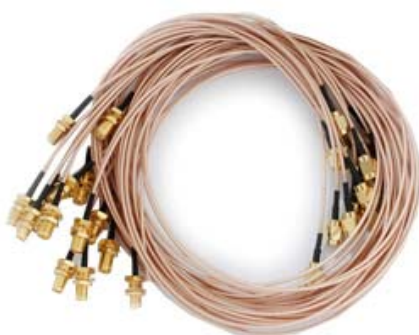
长度1m/衰减小于0.5dB/镀金